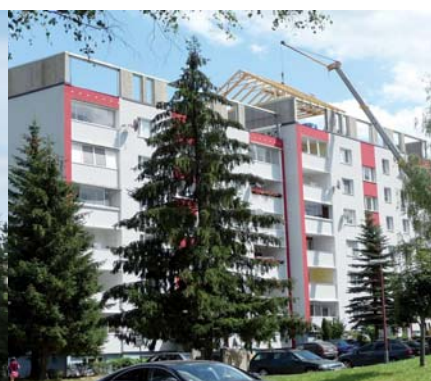
Nadstavba bytového domu v Bardejove. Ľahké panely zaťažili konštrukciu domu veľmi mierne.