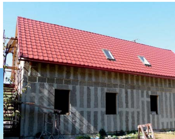
Nízkoenergetický nízkonákladový bytový dom vo Svätom Antone pri Banskej Štiavnici - priaznivá cena panelov a jednoduchá montáž, umožňuje i výstavbu takýchto budov.